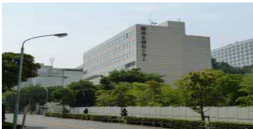
【国民生活センター・東京事務所】外観